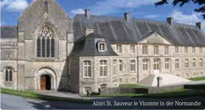
Abtei St. Sauveur le Vicomte in der Normandie

Vielleicht kann uns die hl. Maria Magdalena eine Antwort geben auf die eingangs gestellte Frage nach »gelungenem Leben«. Sie hat das Gottvertrauen erlebt und gelebt und immer wieder erfahren, dass sie nicht allein ist, dass Gottes Liebe und Barmherzigkeit trotz vieler Dunkelheiten den Weg finden lässt. Wir sind jedenfalls sehr dankbar für diese Frau, die als Vorbild nicht nur uns Schwestern heute noch eine Menge zu sagen hat.