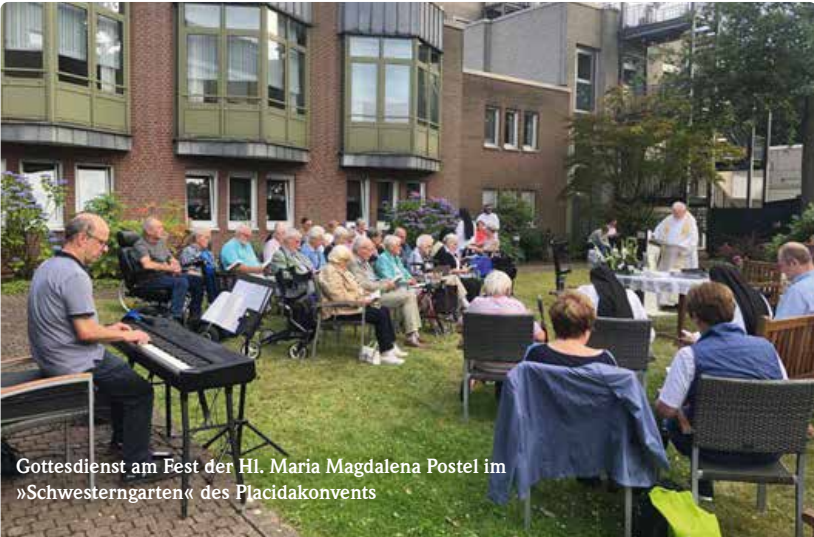
Gottesdienst am Fest der Hl. Maria Magdalena Postel im »Schwesterngarten« des Placidakonvents