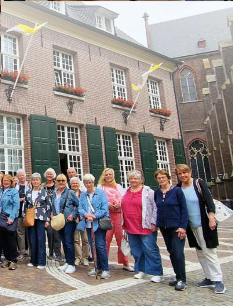
Das Foto zeigt die Teilnehmergruppe der Wallfahrt vor dem Priesterhaus in Kevelaer