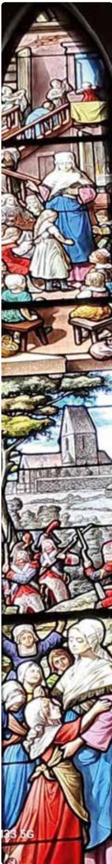
Szenen aus Juli Postels Leben als Lehrerin

Mit 76 Jahren findet Maria Magdalena endlich ein Mutterhaus – eine verfallene Benediktinerabtei – an deren Wiederaufbau sie noch selbst mitarbeitet. Nichts entmutigt sie, was aus dem Zitat spricht: »Gott hat uns nicht berufen, um auf den Ruinen seines Tempels zu weinen, sondern um ihn in seinem ursprünglichen Glanz wieder aufzubauen!« Ihre Kraftquelle, das unerschütterliche Gottvertrauen, hat sie bis dahin gestärkt. Im Alter von 89 Jahren stirbt sie und ihre Gemeinschaft ist zu der Zeit die größte der Diözese. In vielen Kirchen der Region wird sie auch heute noch verehrt. Ihr Lebenswerk existiert seit 1862 in Deutschland, wo 1862 in Heiligenstadt die erste Niederlassung des deutschen Ordenszweigs der »Heiligenstädter Schulschwestern« durch die Selige Placida Viel gegründet wurde. Heute ist die Gemeinschaft international unter dem Namen »Schwestern der hl. Maria Magdalena Postel« außer in Deutschland, in den Niederlanden, Bolivien, Brasilien, Rumänien und Mosambik zu finden. Das Generalat befindet sich in Heiligenstadt (Thüringen), das Provinzhaus in Bestwig (Sauerland).